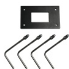
703098000300 LEDBollard-Luke-E Concrete-Mounting-Kit