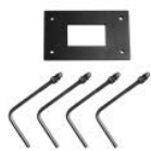
703098000300 LEDBollard-Luke-E Concrete-Mounting-Kit